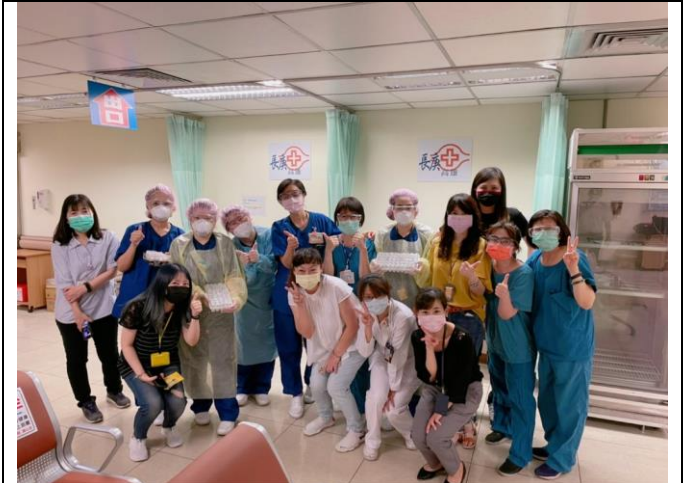
圖二、5月28日至5月30日員工第一劑施打作業完成

區安養機構執行作業。包括大小型接種站及各專案施打加總起來，至今已服務超過6萬人次(圖四)。藥師雖沒有到社區協助施打作業，但仍盡責的做好後援工作，全力協助準備保冰袋及冰磚等物資，無論施打作業到多晚，等施打團隊回到院內後，盡力於最快速度內完成後續的上傳作業。