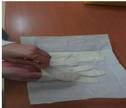
圖六 一手拿起手套反折處，另一隻手伸入手套內將手套戴上