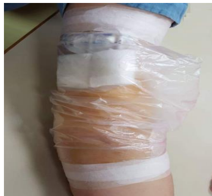
圖十三 以塑膠袋及紙膠包裹周邊植入中心靜脈導管

一、植入此導管的周圍皮膚不能碰到水，以防感染，因此洗澡先以清潔塑膠袋或保鮮膜包裹導管處的手臂，並以膠帶固定 (圖十三)。