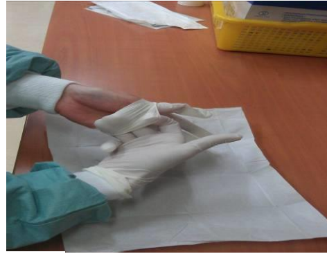
圖九 將未戴手套的手伸入手套內戴上