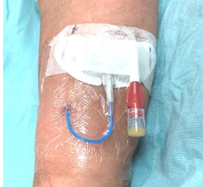
圖十一 以無菌透明敷料完成固定