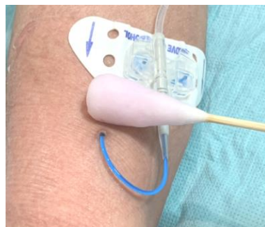
圖四 由傷口中央向外消毒