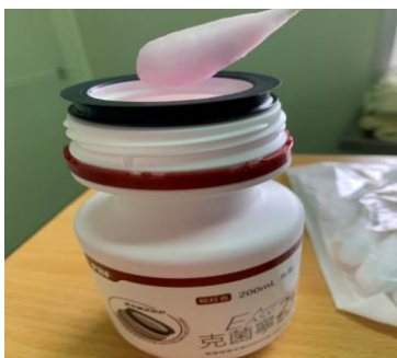
圖三 沾取 2%克菌寧消毒液