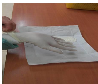
圖七 乳膠手套的尾端包住衣服袖口