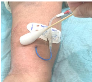
圖二 無菌沖洗棉枝沾滿無菌蒸餾水清潔