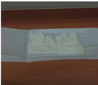
圖五 展開無菌手套