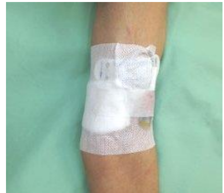
圖十二 以抗敏棉質敷料完成固定