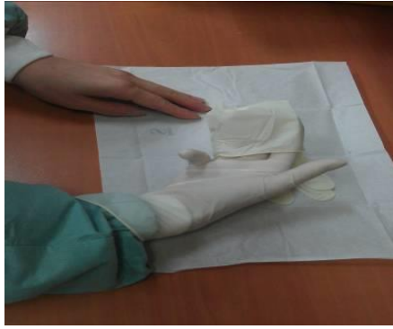
圖八 以戴上無菌乳膠手套的手伸入另一隻無菌乳膠手套反折內撐起手套