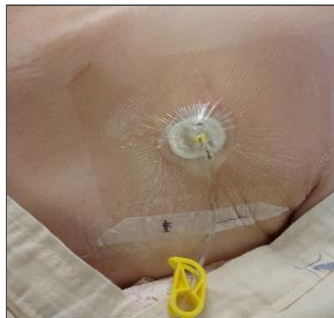
圖四 人工血管使用彎針外觀